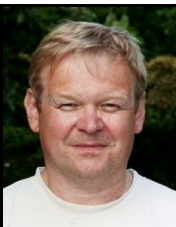
A. Schlechtweg Gemeinderat OR Cremlingen