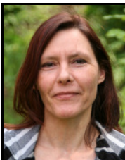
U. Siemens Gemeinderat OR Hemkenrode