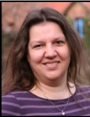
G. Hock Gemeinderat OR Cremlingen